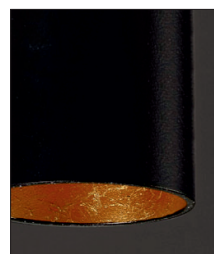
.02.28 Nero foglia rame Black copper leaf