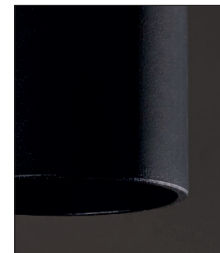
.02 Nero - Black