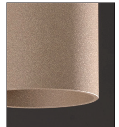
.35 Sabbia - Sand