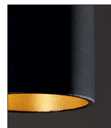
.02.29 Nero foglia oro Black gold leaf