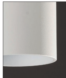
.01 Bianco - White