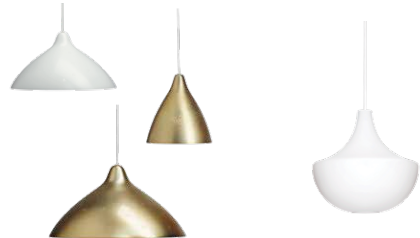
LISA 270 LISA 450